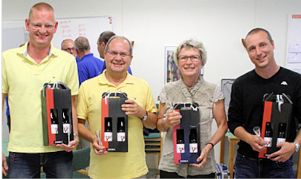
Rico, DOPE og Tulle vandt FM-Klubhold